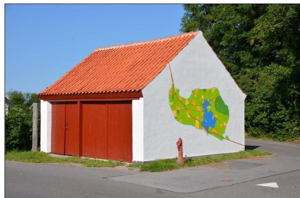
Det renoverede sprøjtehus i august 2015.