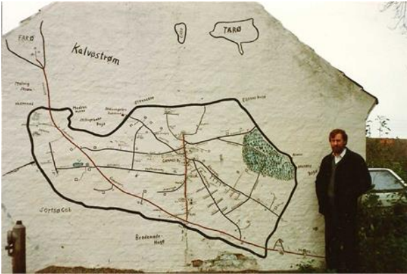
Dines Bogø* på billedet skal krediteres for foto af det renoverede maleri i 1982. Villy Petersen stod for renoveringen. Farødæmningen og vejene i sommerhusområdet er kommet med.